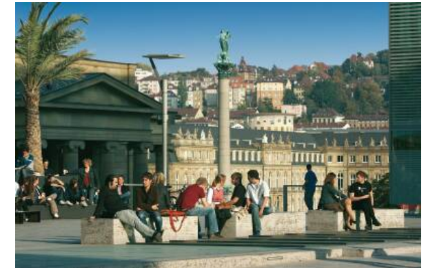
Stuttgart, Kleiner Schlossplatz