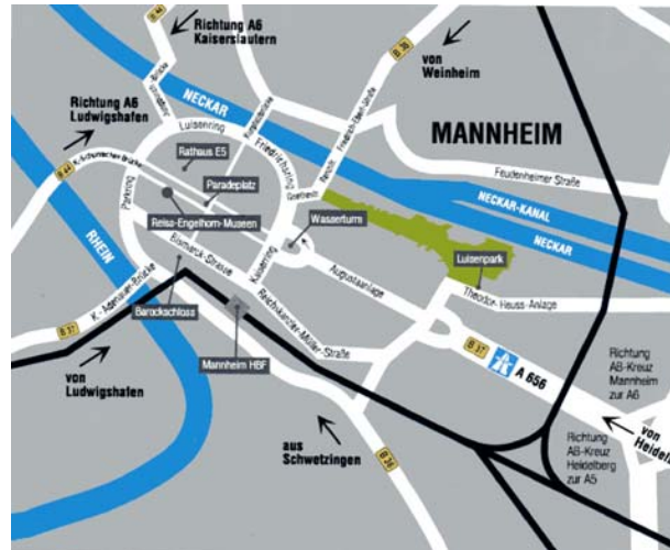
Anfahrt zum Tagungsort in Mannheim