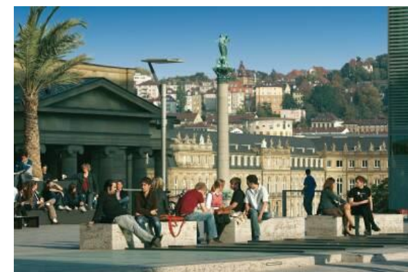
Stuttgart, Kleiner Schlossplatz