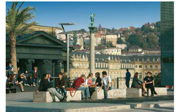
Stuttgart, Kleiner Schlossplatz

am Samstag, dem 17. April 2010 im großen Saal des CVJM Stuttgart e. V. 70174 Stuttgart Büchsenstraße 37