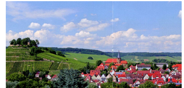
Weinsberg mit Weibertreu

am Samstag, dem 9. April 2011 im Festsaal des ZfP Weinsberg Klinikum am Weißenhof in 74189 Weinsberg